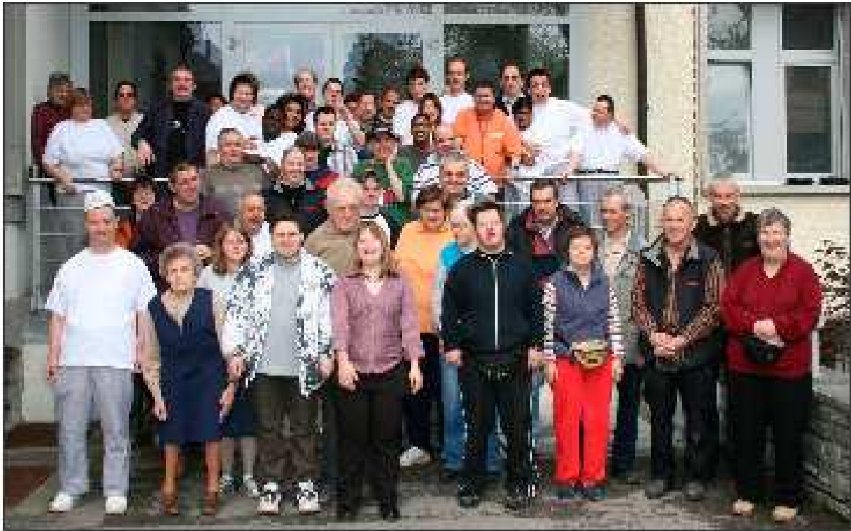
Une partie de l'équipe de la Rosière